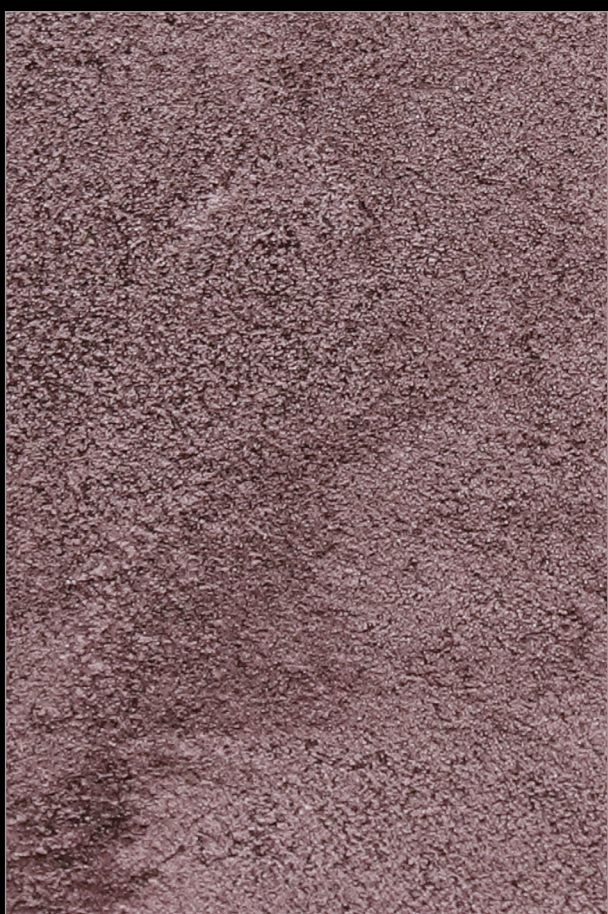
ПРИВЕТ ИЗ АМСТЕРДАМА + M141