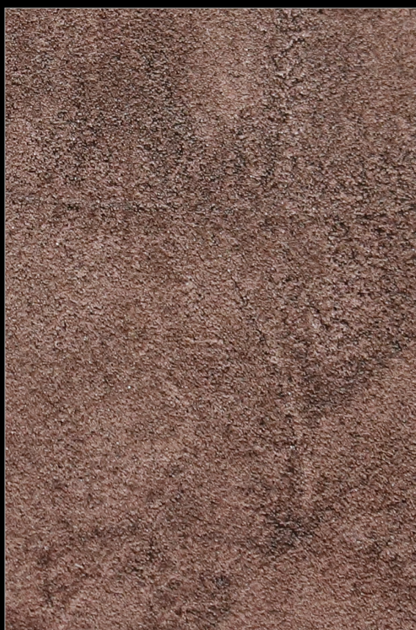
АФРИКАНСКИЙ ВОЖДЬ + Y048

Больше информации о методах и способах нанесения Вы найдете на сайте primavera.by и в профессиональном профиле Instagram @primavera.effects