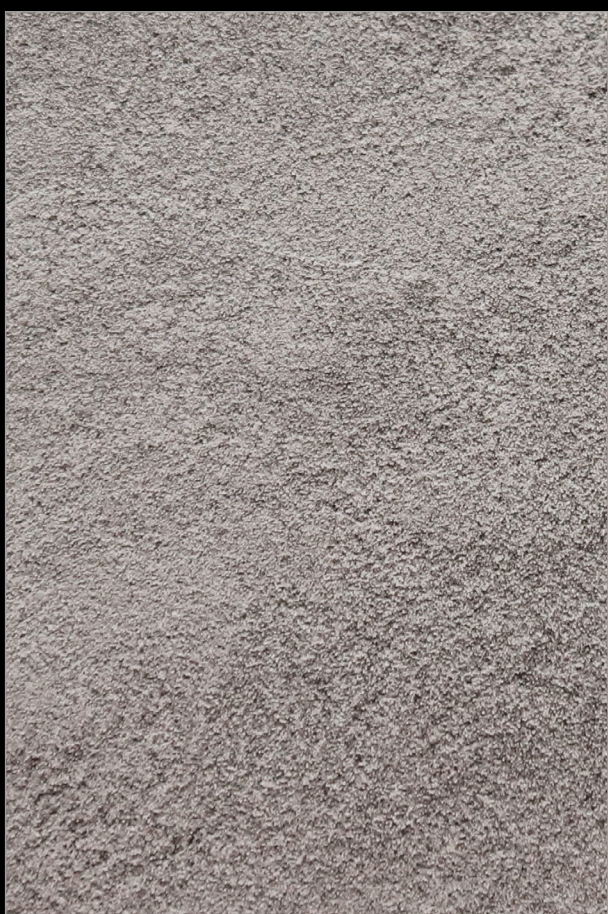
ТУМАННОЕ ПРОШЛОЕ + N163