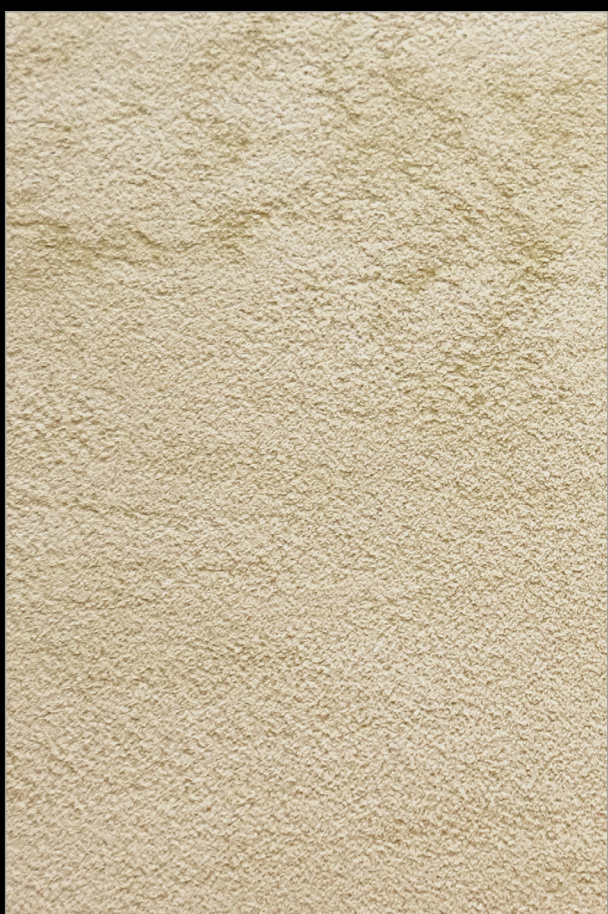
КАСАБЛАНКА + G161