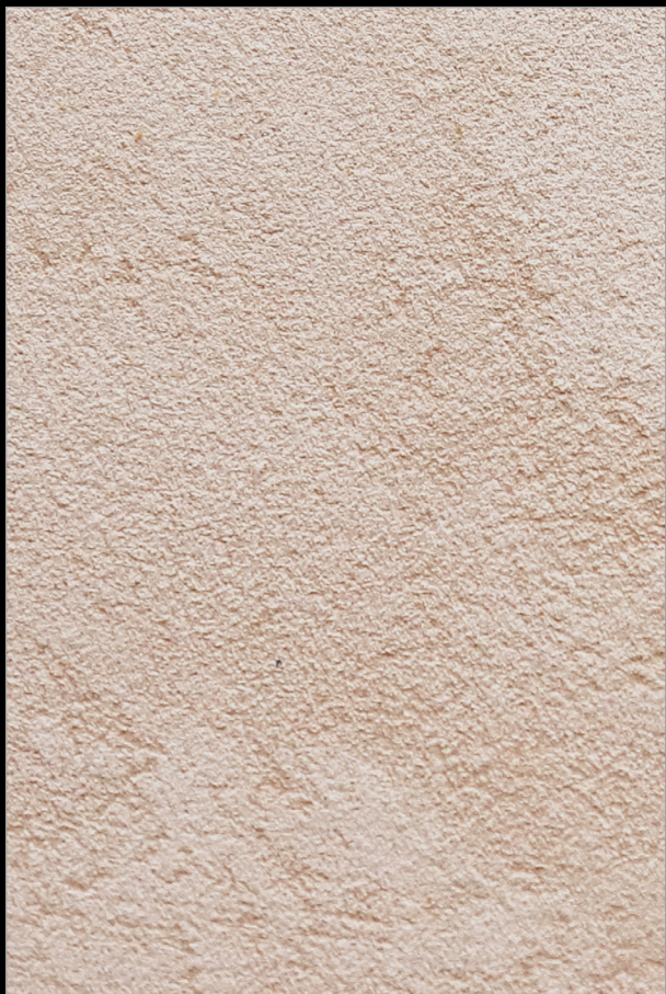
ВЕСНА НА МАДЕЙРЕ-3 + V118