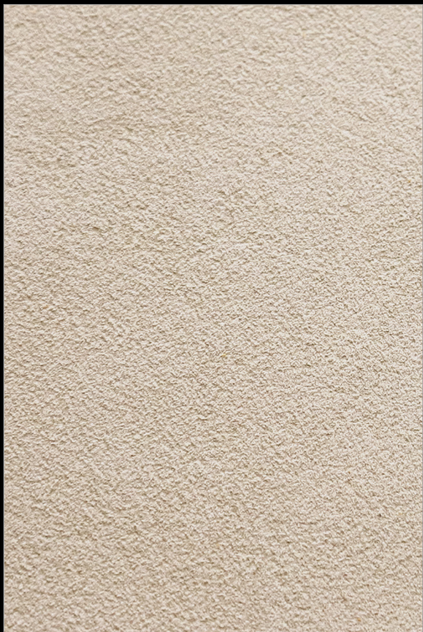
ВЕРНУСЬ В МОНТЕНЕГРО + V104