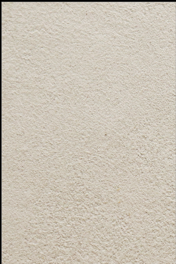
ВАШИНГТОН + G158