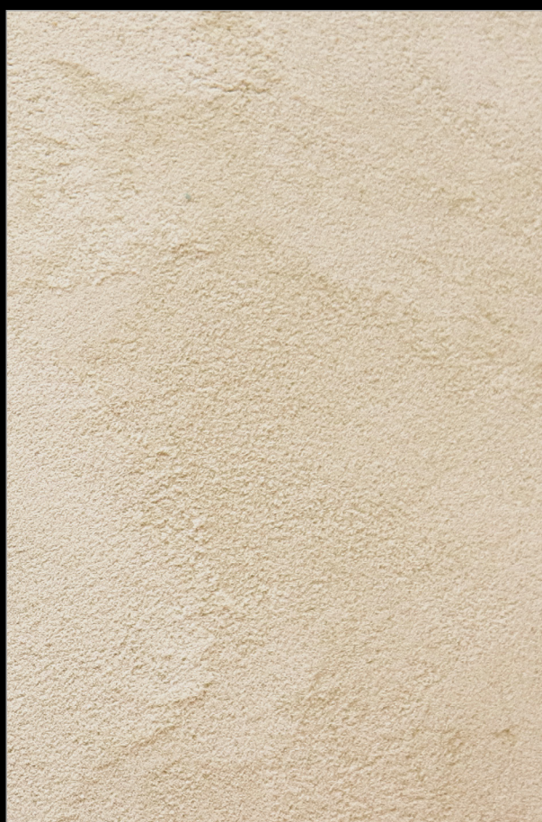
САВОЯРДИ К ЧАЮ + H068

Больше информации о методах и способах нанесения Вы найдете на сайте primavera.by и в профессиональном профиле Instagram @primavera.effects