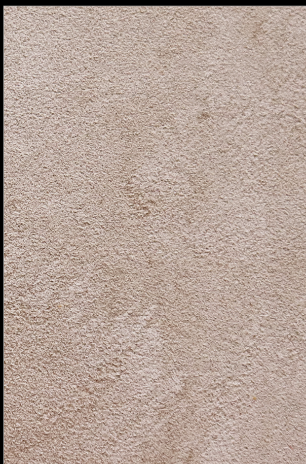
МОККО БЕЗ САХАРА + V109

Больше информации о методах и способах нанесения Вы найдете на сайте primavera.by и в профессиональном профиле Instagram @primavera.effects