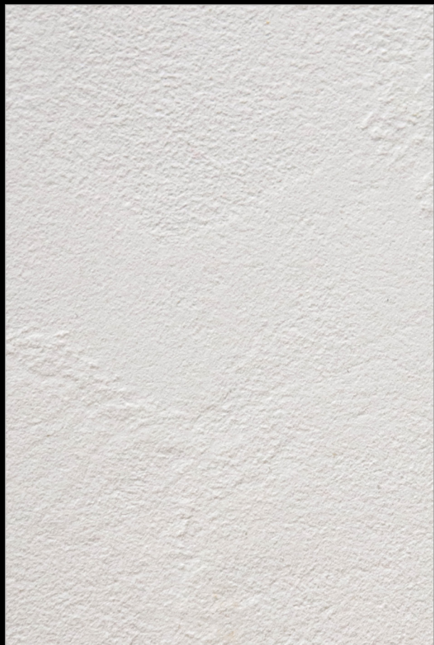
БАЗА - БЕЛАЯ + БЕЛАЯ