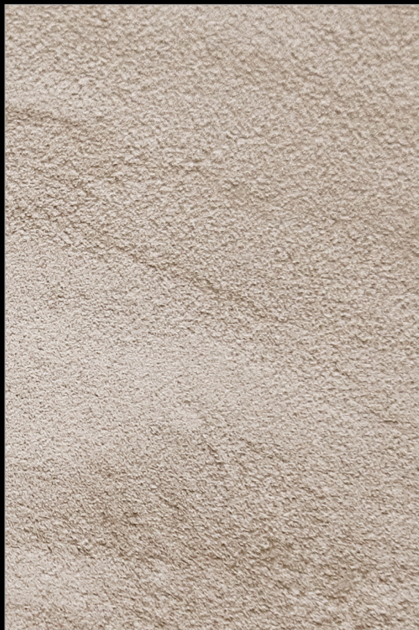
ЖЕМЧУЖИНА ДУБАЯ + H155