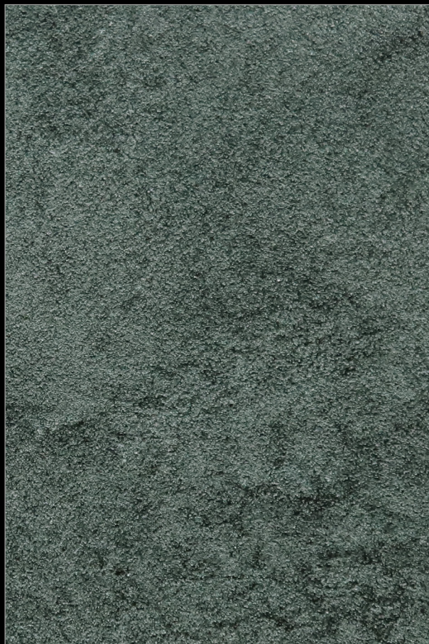
АНГЛИЙСКИЙ БИЗНЕСМЕН + L047