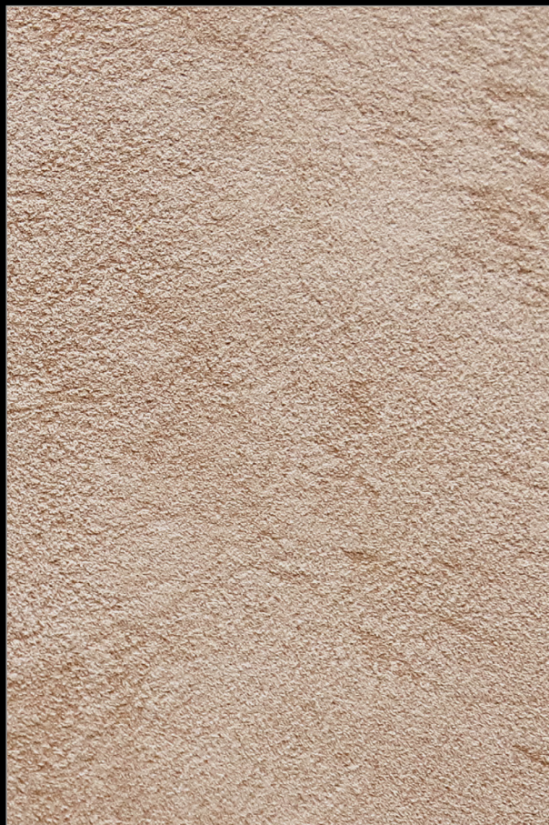
КАНИКУЛЫ В РИМЕ + S126