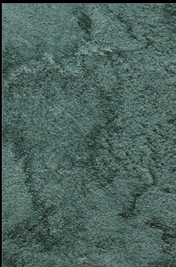
ЗАГАДКА МАДАГАСКАРА + Y167

Больше информации о методах и способах нанесения Вы найдете на сайте primavera.by и в профессиональном профиле Instagram @primavera.effects