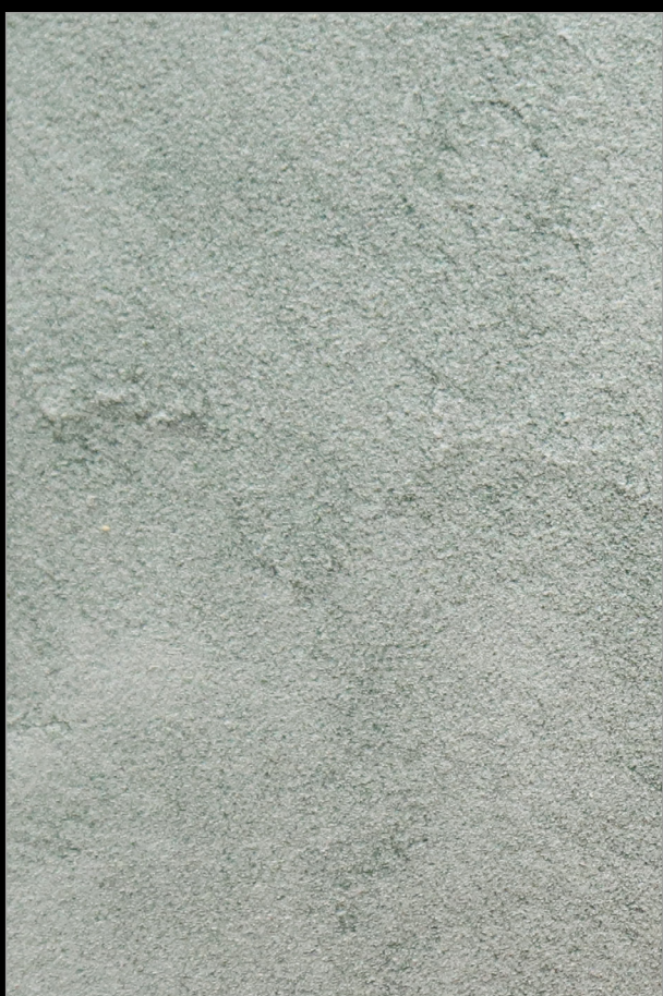
ОСМАНСКИЕ БОЛОТА + N034