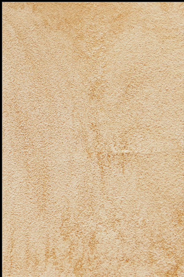
Я В МАДРИДЕ + N084