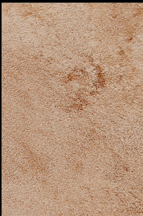
ГДЕ-ТО В ПРАГЕ + K117

Больше информации о методах и способах нанесения Вы найдете на сайте primavera.by и в профессиональном профиле Instagram @primavera.effects