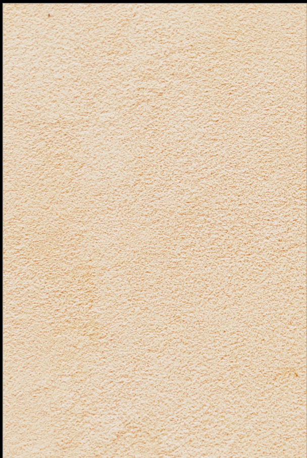
ПИКНИК НА ПОБЕРЕЖЬЕ + G102