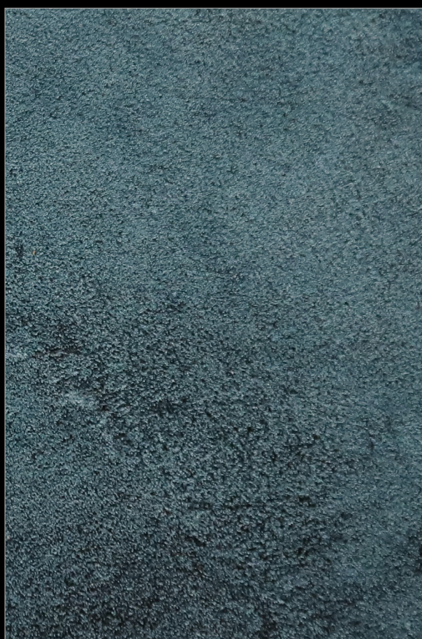
ТОКИО + M030

Больше информации о методах и способах нанесения Вы найдете на сайте primavera.by и в профессиональном профиле Instagram @primavera.effects