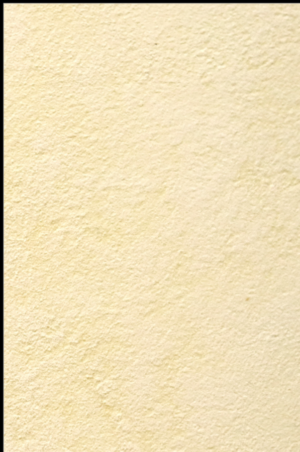
ПИНА КОЛАДА + F076