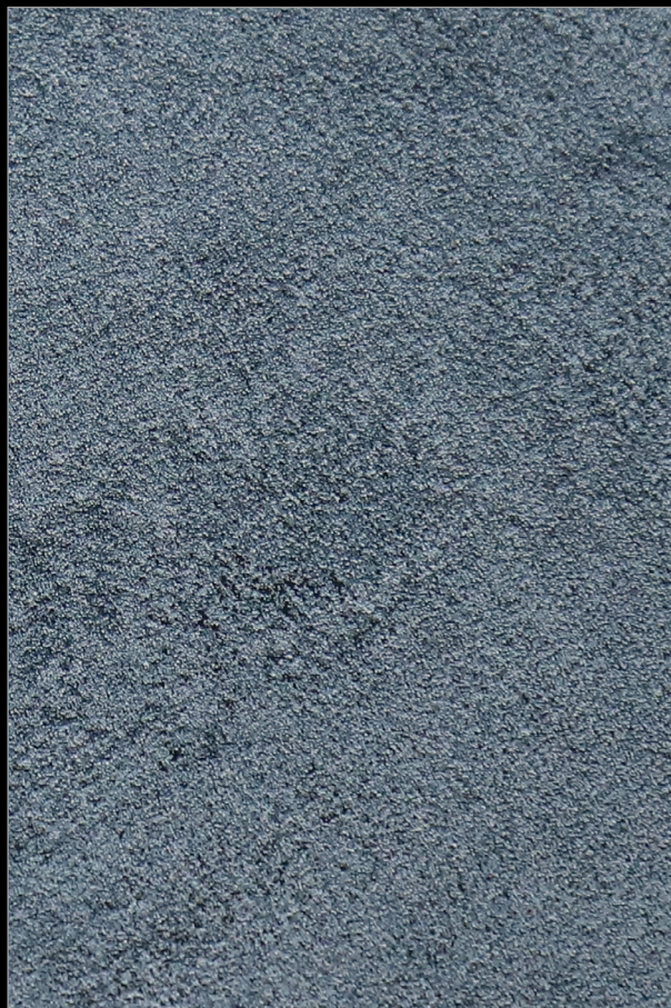
ТАЙНЫ АТЛАНТИДЫ + Y073