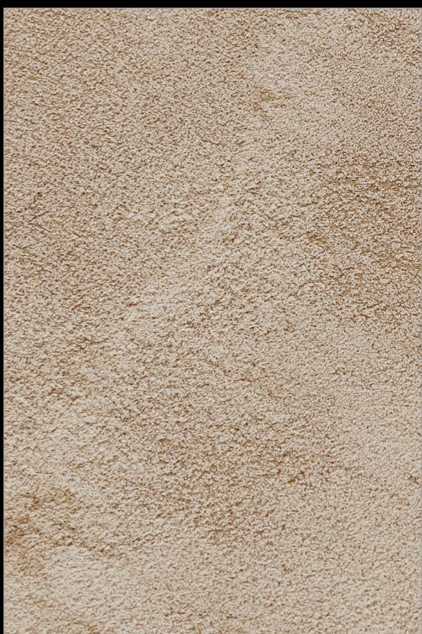
КВАРТАЛЫ КИОТО + X059