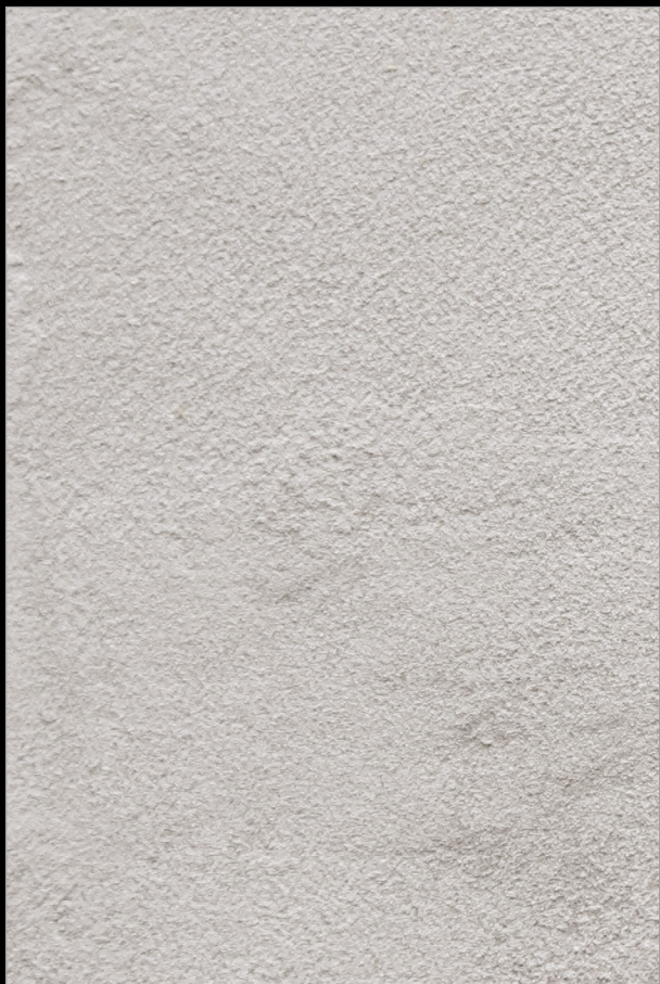
В ПОЛДЕНЬ НА МАНХЕТТЕНЕ + V159